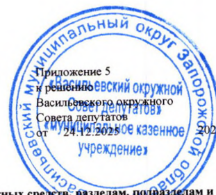
Ведомственная структура расходов бюджета Васильевского муниципального округа по главным распорядителям бюджетных средств, разделам, подразделам и целевым статьям, группам видов расходов классификации расходов бюджета на 2025 год и на плановый период 2026 и 2027 годов (тыс. рублей)