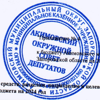
Ведомственная структура расходов бюджета по главным распорядителям бюджетных средств, видам расходов, подразделам и целевым статьям, группам видов расходов классификации расходов бюджета на 2024 год (тыс.руб.)